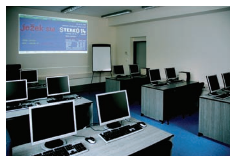
Pohled do naší nové zařízené učebny.

Objednat školení můžete stále prostřednictvím e-mailu skoleni@jezeksw.cz , poštou, faxem nebo na speciální lince školení 731 102 712 , kde vám rádi zodpovíme i veškeré dotazy, na které jste zde nenalezli odpověď.